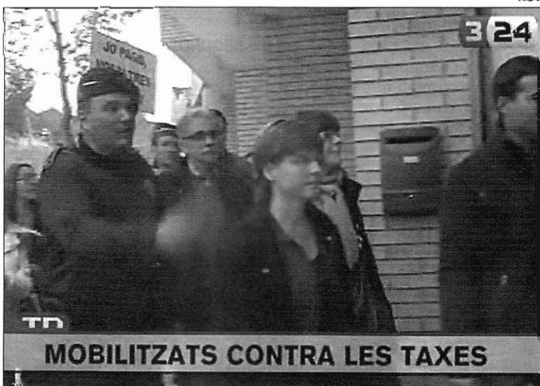
La alcaldesa tuvo que salir de la Casa Consistorial escoltada por la policía.