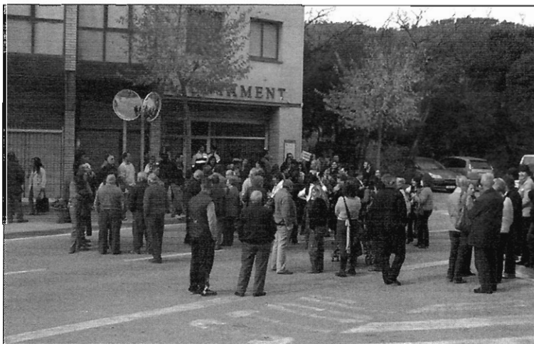
Los vecinos que no pudieron entrar en el pleno estuvieron cortando la calle.

La oposición lleva dos semanas haciendo campaña por todo el municipio: ha colgado pancartas y ha enviado a todas las viviendas una hoja informativa